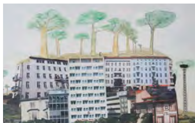
Obra: Álvaro Tamarit

Trabajo final o prácticas en instituciones/empresas (opcional). 1/02-10/09.